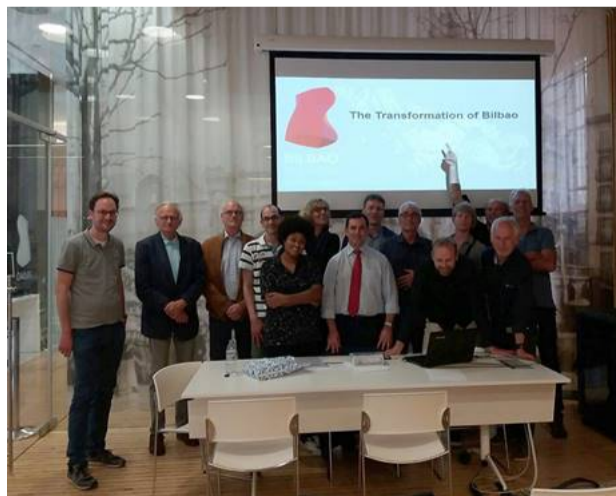
De excursie startte met een toelichting op het 'Bilbao-effect' van de councillor for Urban Planning.

Met veel plezier kijken de deelnemers terug op de excursie naar Bilbao die eind oktober plaatsvond. We zagen hoe een sterke integrale visie vanuit de overheid niet alleen de situatie in een stad, maar ook het imago van een hele regio naar een hoger niveau kan tillen en leidt tot trotse bewoners. De combinatie van het grote gebaar en de aandacht voor de fijne speelplekken in de buurten is essentieel. Lees het verslag van deze interessante en vooral ook gezellige reis.