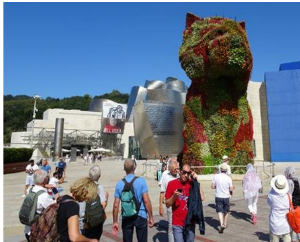
De puppy voor het Guggenheim museum vormt een natuurlijk hoogtepunt.