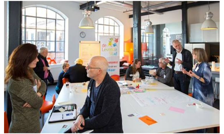
en ambities voor 2018 bij IMOSS